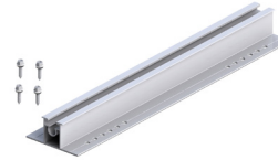
Trapezblechbrücke 2.1 Plus L=400

weitere Artikel finden sie in unserem Produktkatalog oder auf unserer Website: www.mounting-solutions.com